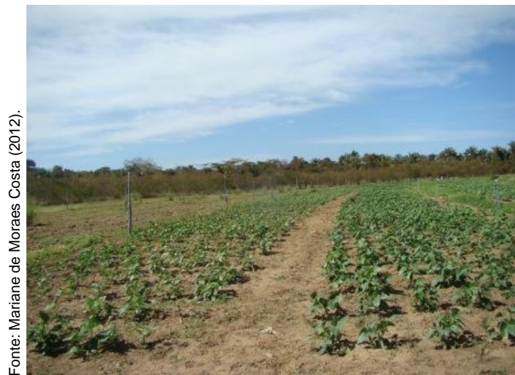
Figura 4 - Experimentos em condições de campo.

Foram conduzidos dois experimentos em condições de campo, com materiais do cruzamento 1 e do cruzamento 2 (Figura 4), onde foram avaliados, na geração da planta, os caracteres agronômicos nas populações P1, P2, F1 12 , F1 21 , F2 12 e F2 21 e, após a colheita, na geração da semente, o caráter o teor de ferro nas populações P1, P2, F2 12 , F2 21 , F3 12 e F3 21 (Tabelas 2 e 3).