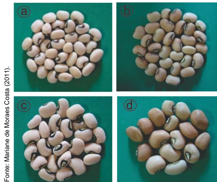
Figura 1 – Parentais utilizados nos cruzamentos: a) BRS Xiquexique; b) BR 17-Gurguéia; c) IT98K-205-8; d) Evx-63-10E.