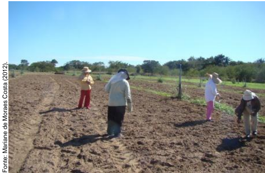
Figura 5 – Plantio dos tratamentos. Teresina, PI, 2012.

O preparo da área consistiu de aração, seguida de uma gradagem. O solo da área experimental é um Argissolo Amarelo de textura franco-arenosa. O plantio ocorreu dia 27 de junho de 2012, colocando-se quatro sementes por cova para os parentais e geração F2 e duas sementes por cova para a geração F1 (Figura 5). Realizou-se o desbaste 15 dias depois, deixando-se uma planta por cova.