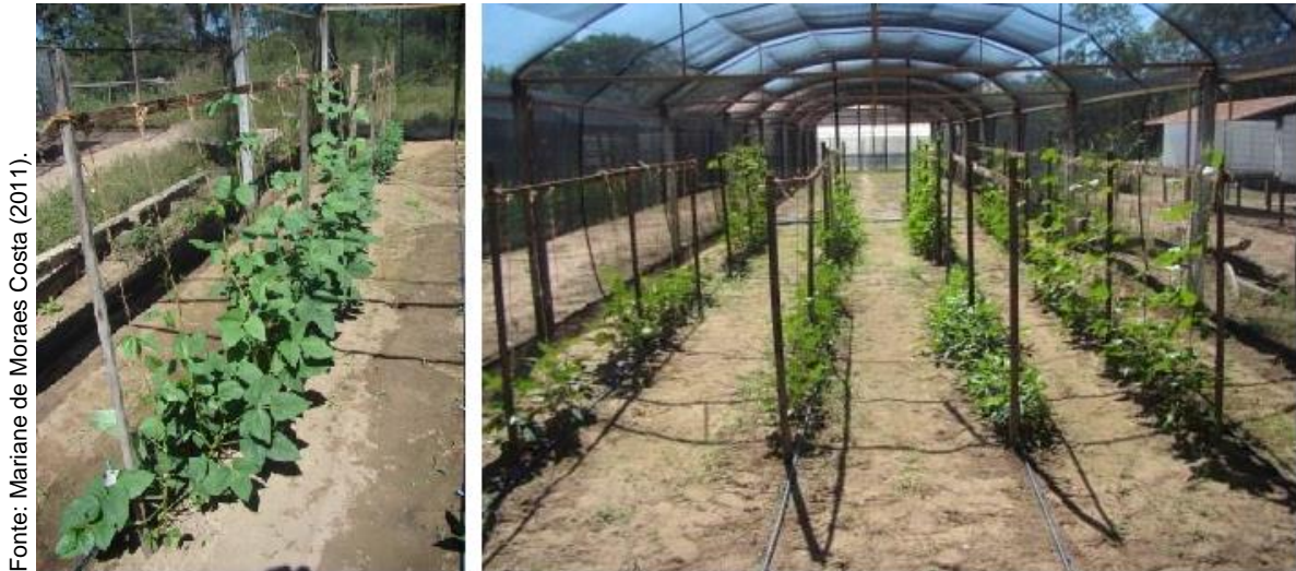
Figura 2 – Parentais (à esquerda) e obtenção das gerações F1 e F2 (à direita) em condições de telado. Teresina, PI, 2011.

Para obtenção da geração F1, utilizou-se a técnica de cruzamento em que a coleta de pólen do parental masculino é realizada pela manhã e a emasculação do botão floral do parental feminino e as polinizações, no período da tarde, segundo Rêgo et al. (2006) (Figura 3).