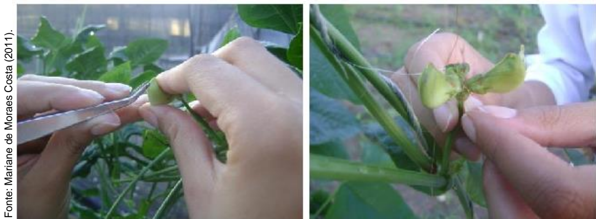
Figura 3 – Realização de cruzamentos em telado. Teresina, PI, 2011.

Para obtenção da geração F1, utilizou-se a técnica de cruzamento em que a coleta de pólen do parental masculino é realizada pela manhã e a emasculação do botão floral do parental feminino e as polinizações, no período da tarde, segundo Rêgo et al. (2006) (Figura 3).