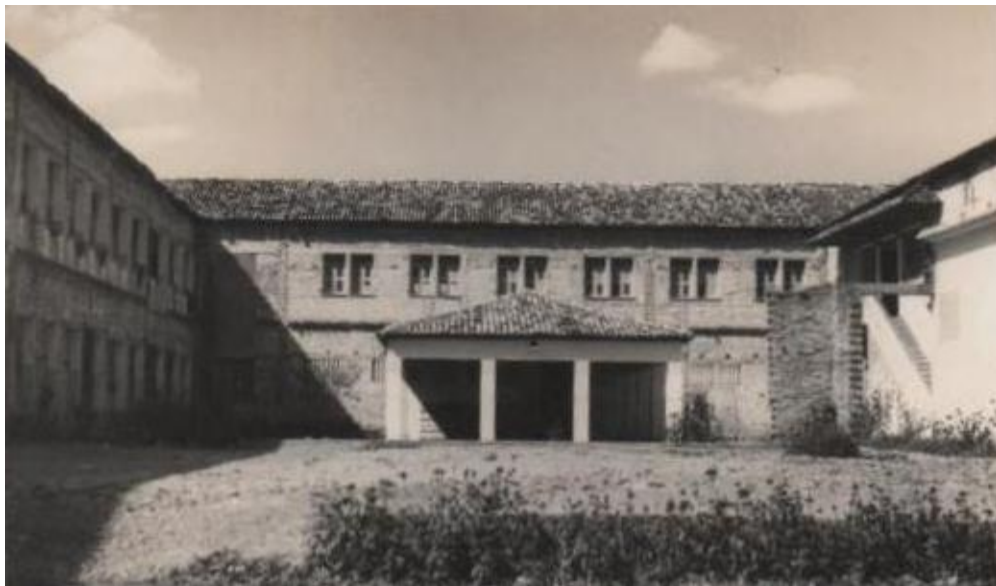
Figura 05 - Fachada do Colégio São José na década de 1970

Podemos observar na foto 05 os detalhes de como se constituiu o espaço escolar do Colégio São José, quando sua estrutura estava completa e necessitava apenas do acabamento, que mais tarde foi feito.