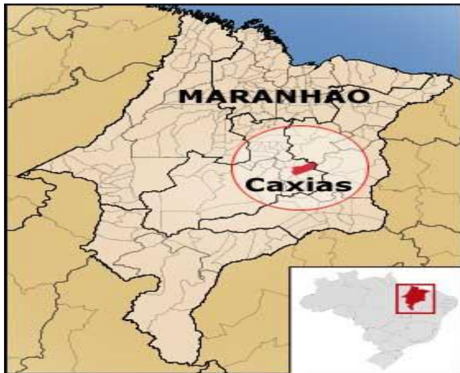
FIGURA 1 - Mapa do Maranhão situando a cidade de Caxias

Caxias é um município do Estado do Maranhão. Foi fundado no século XVIII à margem do rio Itapecuru, nos pontos mais altos de um vale ribeirinho. Foi ao longo do curso do rio Itapecuru que se desenvolveu uma importante etapa da agricultura e pecuária maranhense a partir do século XVIII.