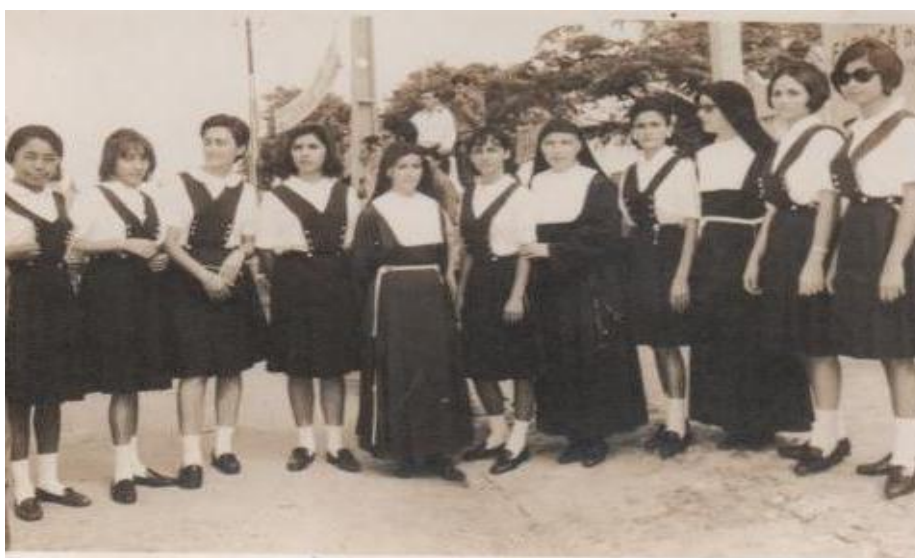
Figura 22 - Alunas uniformizadas (1950)

O fardamento era importante, pois deixava as alunas adequadamente vestidas, para que não demonstrassem nenhum sinal de desleixo para com o corpo e para com as normas do Colégio. Todas deviam está sempre bem compostas e penteadas. O uniforme de” gala” usado pela Escola Normal era composto de saia azul e blusa de mangas comprida, sapatos e meia branca. Este uniforme era especial e só devia ser usado em momentos importantes, festas e solenidades.