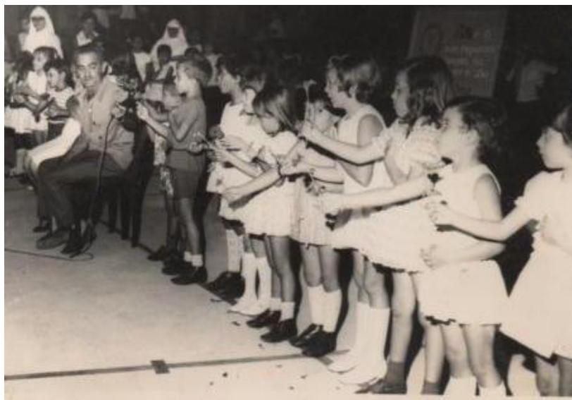
Figura 14 - Comemoração da festa do dia dos pais (1970)

O Colégio São José tinha como prática tradicional a festa do dia dos pais realizada pela escola, onde todos eram convidados a participar do evento que sempre era acompanhado de cerimônia religiosa, como a missa para que pudessem agradecer a Deus pelos trabalhos desempenhados na escola. A presença dos pais nas atividades escolares era expressiva, pois todos como bons católicos deveriam está envolvidos nas atividades educacionais e religiosas das Irmãs educadoras.