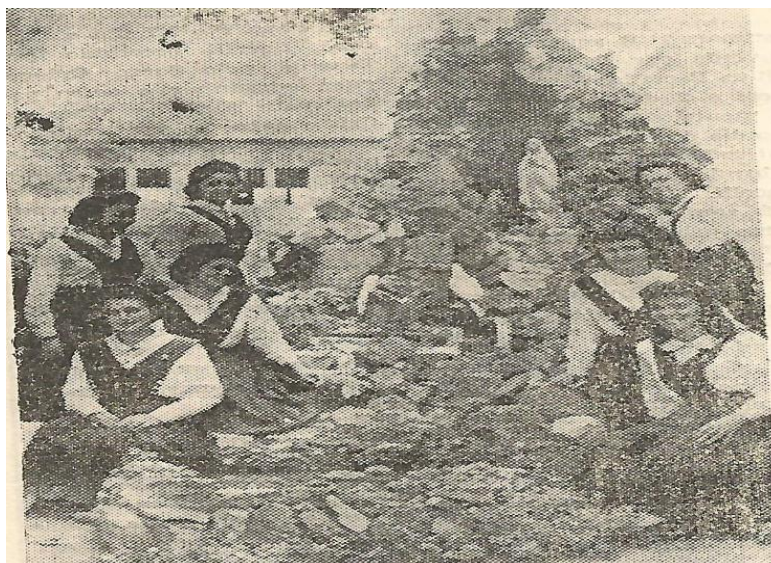
FIGURA 27- Alunas na coroação da Virgem Maria – Colégio São José (1958)

Havia um destaque especial dado as celebrações dedicadas a Virgem Maria. A movimentação em volta dessa festa religiosa ocorria no mês de maio. O “mês mariano” era comemorado pelas alunas do Colégio. No encerramento das comemorações do mês de maio acontecia a coroação da virgem, um ritual repetido anos após anos e sempre celebrado com muita pompa.