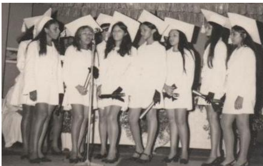
Figura 21- Jogral em homenagem a São Francisco de Assis (1970)

Havia dentre as muitas festividades promovidas pelo Colégio, uma em especial que era sempre lembrada e esperada não apenas pelas alunas e religiosas da congregação, mas também pela sociedade caxiense. A festa em homenagem ao dia de São Francisco era um evento grandioso. As encenações promovidas pelas alunas como forma de reverenciar e homenagear o mártir trazia inúmeros pais e representantes eclesiásticos para o interior da escola. As peças teatrais, e os musicais apresentados ficaram impregnados na história do Colégio. A figura 21 nos remete ao sentimento de veneração dedicado ao mártir católico.