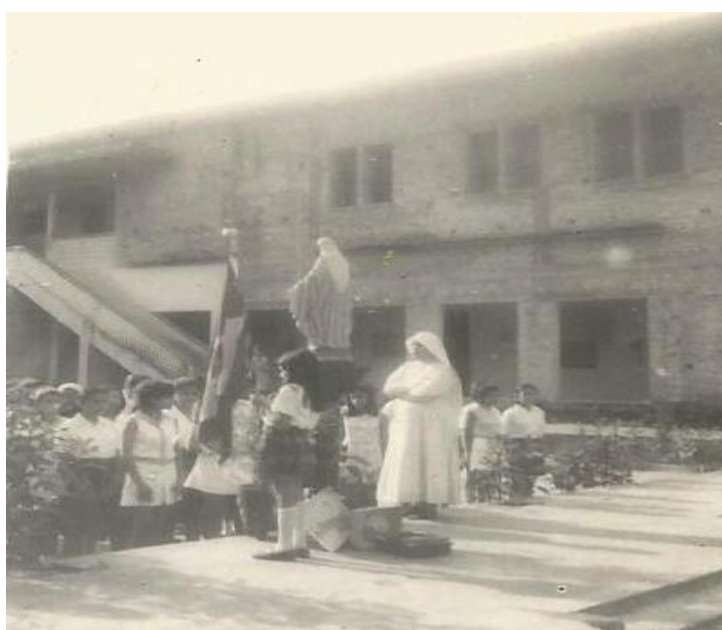
Figura 26 - Alunas no Pátio do Colégio São José em momento de oração (1960)

Em outros momentos também se vivenciava a prática da oração como nas aulas de religião que tinham nos ensinamentos católicos a conduta que deveria ser seguida pelas meninas e moças para que fossem conduzidas á Deus.