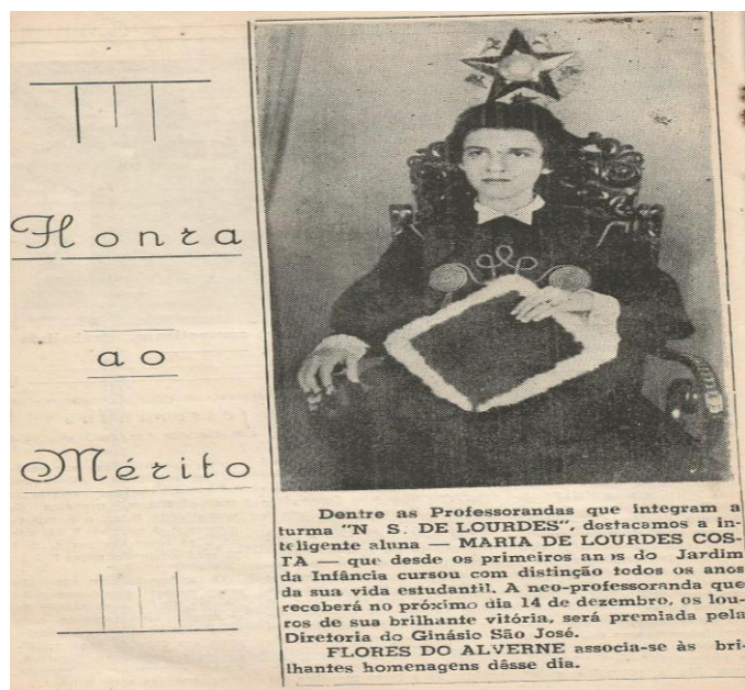
Figura 28- Aluna homenageada na revista do Grêmio Santa Joana d'Arc - 1958

Exigia-se por parte das alunas um bom comportamento, uma educação baseada nos ensinamentos e princípios religiosos praticados pelo Colégio. Fazia parte também do rol do bom comportamento as saudações aos professores, as irmãs, quando as encontrassem nos corredores ou na sua chegada á sala de aula, o ato de cumprimentar a Madre Superiora toda vez que a visse ou que adentrasse as salas de aula. O silêncio na capela também complementava os bons hábitos desenvolvidos pelo Colégio. A revista pertencente ao Grêmio escolar prestou á alunas que se destacavam por seus feitos e por suas atitudes no contexto escolar.