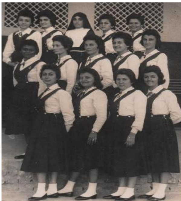
Figura 23 - Alunas do ensino Normal em uniforme de Gala (1960)

O uniforme usado pelas alunas do Curso Normal visava proteger a virtude e a pureza da mulher que devia ser mantida sobre sobriedade e discrição, jamais rompendo com o regulamento e os padrões tradicionais da escola. A figura 22 apresenta as alunas uniformizadas com seus trajes colegiais usados no dia-a-dia do Colégio. As blusas possuíam mangas curtas, a saia tinha a altura do joelho, acompanhado de sapato e meias de cor branca conforme estabelecido no regulamento do Colégio. As vestimentas de Gala deveriam ser usadas em ocasiões especiais e específicas como as festividades escolares, mas não fugiam dos padrões estabelecidos pelas irmãs de estarem devidamente compostas usando roupas adequadas e discreta.