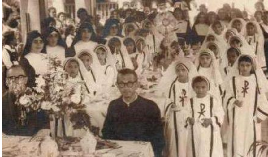
Figura 13 – Missa de 1ª comunhão realizada na Capela do Colégio São José (1958)

Um dos espaços de sociabilidade mais concorrido em Caxias estava sempre ligado àqueles onde se realizavam as festas religiosas. Caxias possui uma história marcada pela forte presença do catolicismo, a cidade possuía um calendário devocional que compreendia todos os meses do ano.