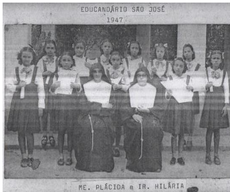
Figura 04 - Alunas do Educandário São José (1947)

A figura 04 nos remete a postura das freiras capuchinhas sempre alinhadas e assim também promoviam esse comportamento nas meninas educadas no Colégio. Embora crianças, já se portavam com ordem e arrumadas como forma de obediência a hierarquia. As irmãs apresentadas na fotografia compõem o grupo de freiras que ajudaram no trabalho missionário educativo em Caxias.