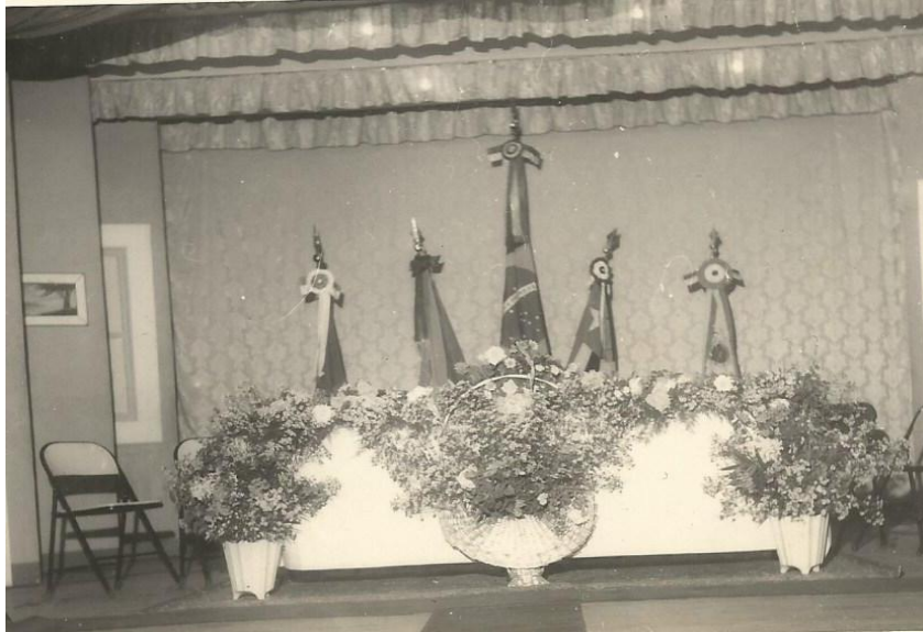
Figura 19 - Mesa ornamentada para a cerimônia de formatura (1958)

ilustra a importância dos eventos no Colégio, o zelo e os cuidados dispensados aos cerimoniais realizados no Colégio.