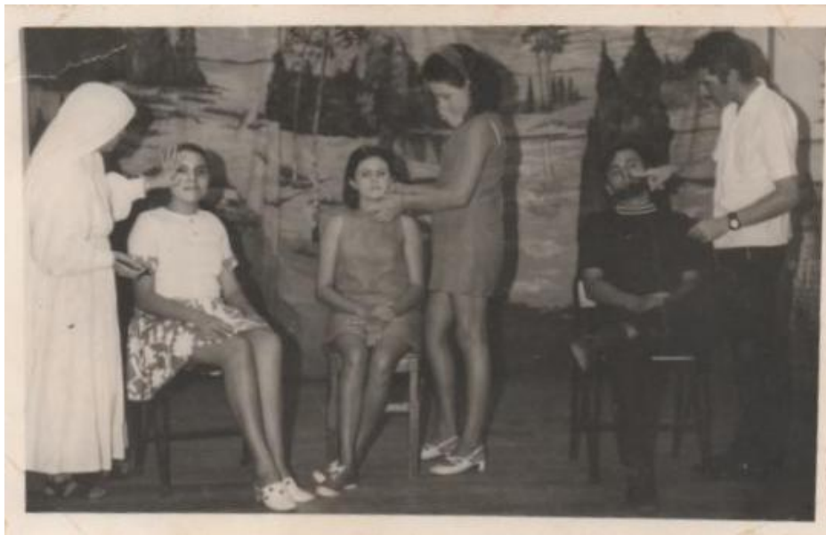
Figura 09 - Curso de teatro realizado pelo Grêmio Santa Joana d' Arc Colégio do São José- (1970)

As festas promovidas pelo grêmio eram sempre acompanhadas de muito entusiasmo por parte das alunas que se esforçavam em promover as sessões culturais, em demonstrar as habilidades adquiridas no seio da escola através dos ensinamentos transmitidos a elas.