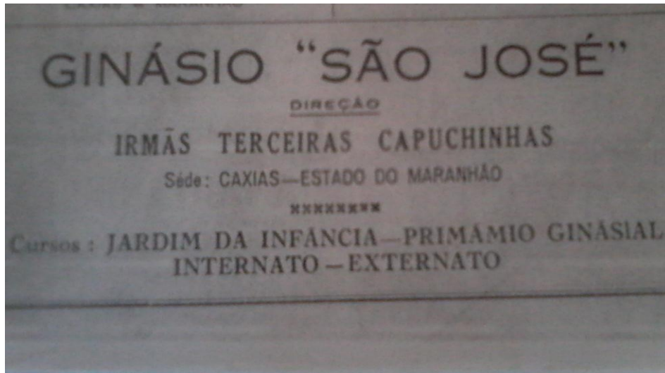
Figura 12 – Anúncio dos cursos do Colégio São José (1954)

Além das mensalidades ainda eram cobradas taxas extras para que as alunas tivessem aulas particulares de determinadas disciplinas, que careciam ser reforçadas, ou mesmo de atividades que complementassem os estudos, a exemplo aulas de piano, datilografia, pintura e trabalhos manuais. Convém mencionar que o valor do salário mínimo pago no Brasil no ano de 1949 era de Cr$ 380,00. Portanto o valor cobrado pela instituição para as mensalidades era superior ao salário mínimo vigente na época. O prospecto com que as irmãs divulgavam a educação das alunas enfatizava um modelo educacional capaz de modelar o caráter das educandas. O anúncio do Colégio evidenciava os níveis de ensino: