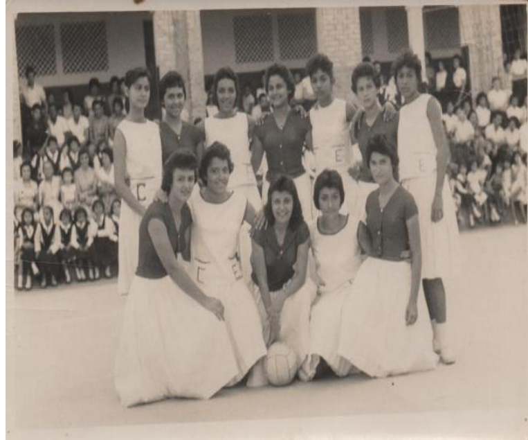
Figura 08 - Alunas do Colégio São José em atividade recreativa (1957)

O grêmio do Colégio São José, possuía personalidade jurídica, e recebia subvenções que eram administradas pela Irmã Diretora, que por sua vez respondia judicialmente pelo grêmio. A figura 08 destaca uma partida de voleibol disputada pelo time pertencente ao grêmio.