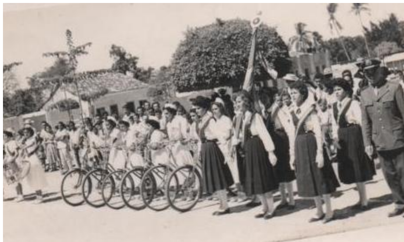
Figura 17 – Desfile de 07 de setembro - Colégio São José (1970)

Havia muitas alas temáticas alusivas as festividades da Pátria, era um dia único, todas as alunas deveriam está envolvidas, deviam comparecer devidamente vestidas para a ocasião, suas vestes de gala, uniforme de festas, as destacavam dentre os demais que assistiam a comemoração. Tratava-se de uma festa importante para todos envolvidos no Colégio. Vejamos na figura 17 o desfile apresentado pelo Colégio.