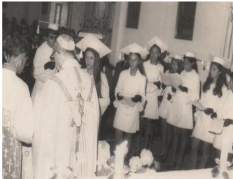
Figura 18 - Missa de Formatura das alunas do Colégio São José (1970)

Noticiado pelo Jornal Católico de circulação semanal, as festas de formaturas eram organizadas com muita pompa, sendo uma comemoração que expressava o modelo e o ideal educacional praticado pela ordem missionária na cidade. A figura 18 reflete a presença da igreja católica na formação profissional das alunas.