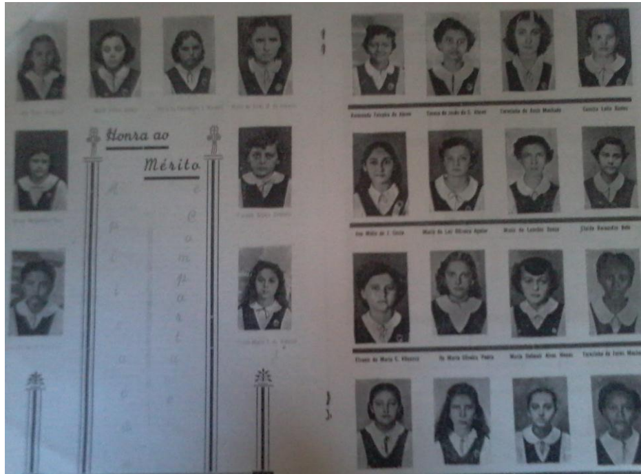
Figura 11 - Fotos das alunas que compunha o quadro de honra do colégio São José ano (1954)

Pertencer ao Quadro de Honra do Colégio simbolizava não apenas uma conquista intelectual, mas um prêmio de reconhecimento moral em virtude da aplicação e do comportamento da aluna. Estes quadros denominados de “Quadros de Honra ao Mérito” era uma premiação feita em todas as modalidades de ensino presente no Colégio. Outras escolas também se utilizavam desse recurso como podemos ver em Manoel (1996, p. 96), que descreve este e outros o tipo de prêmios empregado pelos Colégios ao Homenagearem suas alunas.