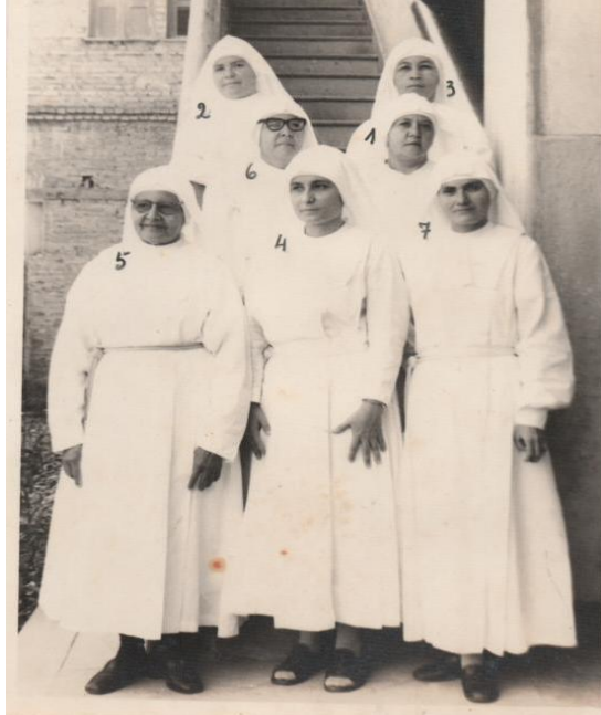
Figura 10 - Fraternidade das irmãs Capuchinha em Caxias no Colégio São José