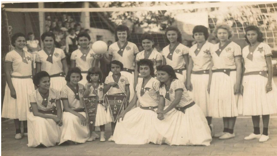
Figura 24 - Alunas vestidas no uniforme do Time de voleibol (1958)

Existia uniformes específicos para a prática da ginástica e as práticas esportivas, pois não se permitia que as alunas se vestissem da forma como quisessem, as vestimentas refletiam os conceitos morais da educação cristã. O time de vôlei formado pelas alunas do Curso Normal da década de 1950 pode ser visualizado na imagem na figura 24.