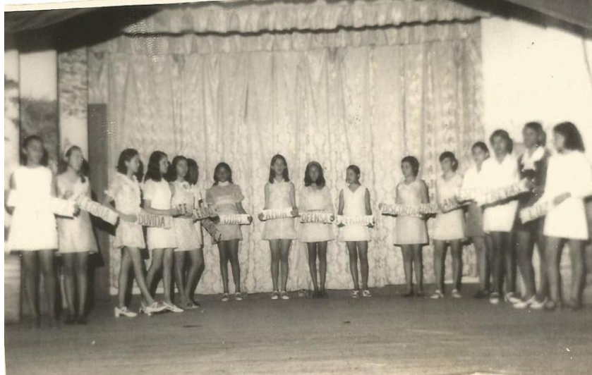
Figura 20 - Formandas do Ensino Normal (1970)