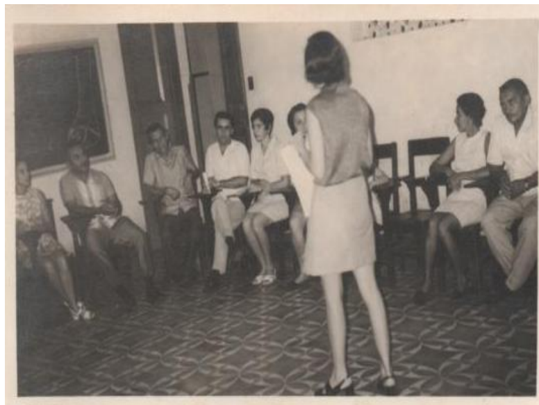
Figura 07- Reunião da associação de pais e mestres do Colégio São José (1971)

Os conteúdos discutidos nas reuniões de pais e mestre não eram apenas o desempenho e a necessidades educacionais do aluno, mas o apoio que família poderia desprender para ajudar no alcance e concretização dos objetivos educacionais do colégio. Nas reuniões os pais eram lembrados de seus deveres para com os filhos, assim não descuidariam de dar assistência necessária ao bom andamento do projeto formativo da escola.