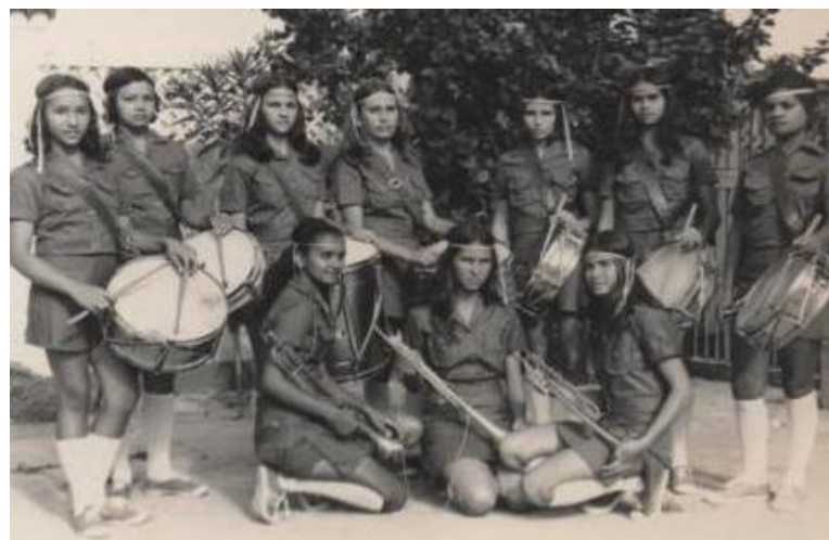
Figura 16 – Banda do Colégio São José - 07 de setembro 1970

Havia um grande empenho por parte das alunas para que o Colégio fosse premiado com o primeiro lugar no desfile do dia 07 de setembro, todos deviam se empenhar para que tudo transcorresse em conformidade como esperado. O desfile era imponente ao homenagear á pátria demonstrando que a tônica era, como em outras ocasiões, a “exaltação á Pátria, louvor á Deus e disciplinarização do trabalhador” (SENA, 2010, p. 284). As alunas dedicavam-se aos treinos para que houvesse apresentações capazes de chamar atenção do público que as assistia, conforme visualizamos na figura16.