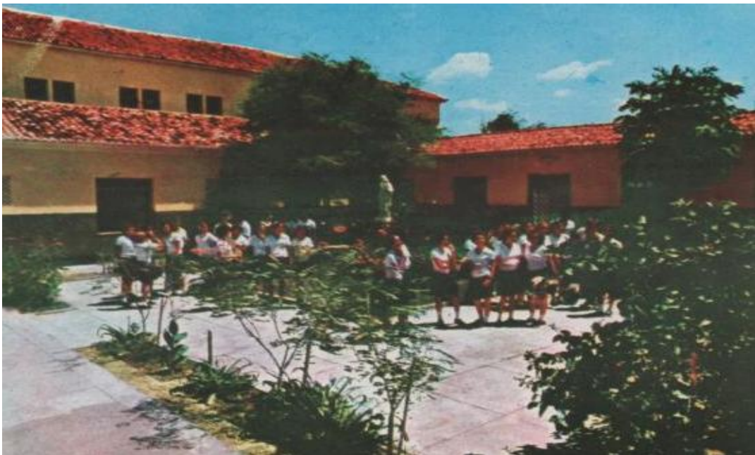
Figura 06 - Fachada interna da escola construída (1979)

A construção do prédio acabou por consolidar o trabalho das irmãs missionário no aspecto educacional. Para a ordem missionária era muito importante à aquisição do espaço físico e constituíam-se numa práxis própria da ordem as irmãs manterem-se independente para que pudessem desenvolver com plenitude seus trabalhos. Podemos vislumbrar abaixo o Colégio concluído com todas as suas dependências em funcionamento.