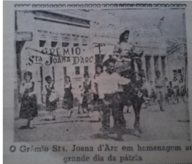
FIGURA 15 - Desfile de 07 de setembro (1958)

Assim ocorriam os desfiles na cidade de Caxias, preparando para disputas entre as escolas para que alcançassem notoriedade em suas apresentações no período da Festa da Pátria.